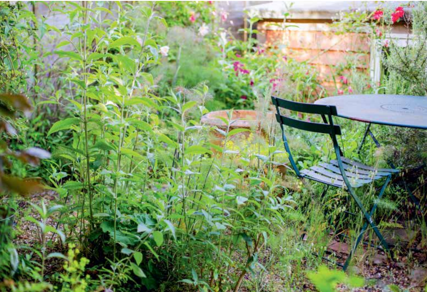
In dieser wilden Gartenecke versammeln sich im Sommer Schmetterlinge und Bienen in der üppigen Pflanzung von Sommerflieder, während auf niedrigerer Ebene Igel und Kröten im bewusst unaufgeräumten Bewuchs Zuflucht finden.