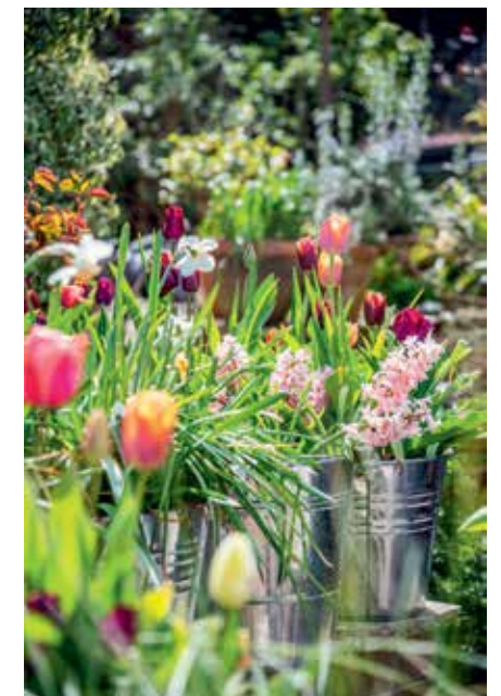
Wiesen voller Blumenzwiebeln sowie Eimer mit Tulpen und Hyazinthen erhellen die grauen Tage des Frühlings.