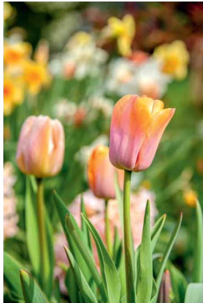
Eine der Freuden beim Pflanzen von Tulpen liegt in der Vielfalt an Stimmungen und Wirkungen, die sich durch unterschiedliche Farbkonzepte erzielen lassen.