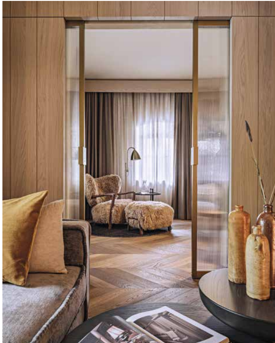
Suiten im Platzl Hotel, Dreimeta

„Das Innere eines Ortes ist nie nur Design. Es ist eher eine Aura, und die ist nichts, was man kaufen, planen oder rendern kann. Sie entsteht durch Geschichten und durch Menschen.“