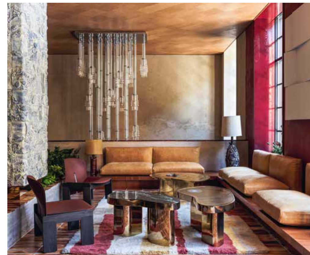
The Manner Hotel, Hannes Peer Architecture

Haltung würdigen. Weil wir Gastgeber und Gastgeberinnen feiern, die tun, was in dieser Branche am schwierigsten ist: Sie schaffen Orte, die bleiben. Orte, die uns guttun und die uns verbinden. Und wenn wir Glück haben, findet sich vielleicht der eine oder andere neue Lieblingsplatz darunter für jeden und jede, der oder die dieses Buch aufschlägt. Vielleicht sogar einer, der ein kleines Stück Heimat in uns zurücklässt – auch wenn wir nur auf der Durchreise sind.