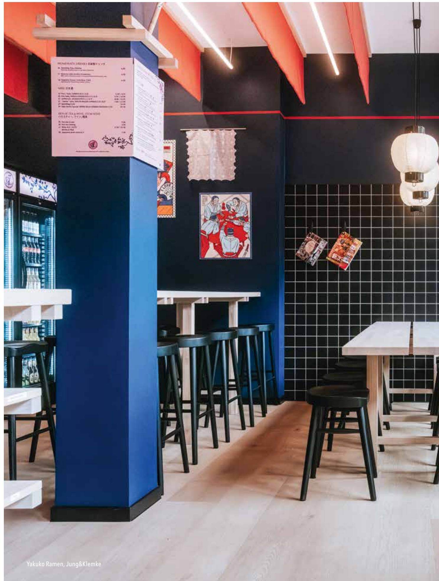
Yakuko Ramen, Jung&amp;Klemke

Wenn wir über die schönsten Restaurants, Hotels und Bars 2026 sprechen, dann sprechen wir nicht über das Teuerste, das Glatteste oder das Beeindruckendste. Wir sprechen über Orte, die uns als Menschen ernst nehmen. Orte, die uns erkennen und willkommen heißen. Orte, die uns nicht überreden, sondern überzeugen. Ich freue mich, Teil der Jury dieses Buchprojekts zu sein. Nicht, weil wir hier Schönheit prämiieren, sondern weil wir