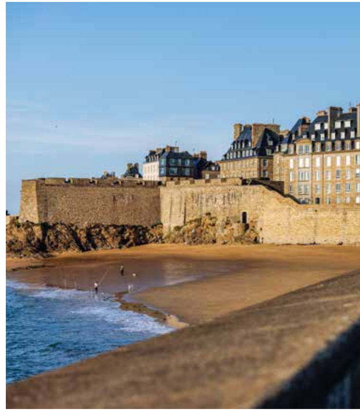
Nicht immer ist das Meer so ruhig – an stürmischen Tagen „duscht“ es die Besucher auf der Festungsmauer.

Etwa 60 Kilometer vor Rennes hört die Autobahn plötzlich auf. Endlich zurück in der Bretagne, wo die Uhren langsamer und die Menschen ihren eigenen Rhythmus gehen. Das Fehlen der Schnellstraßen, so erzählt man, gehe auf Anne zurück, die letzte Herzogin der freien Bretagne. Als Symbol der bretonischen Eigenständigkeit soll sie verfügt haben, dass hier niemals Straßenmaut erhoben wird. Ohne Einnahmen kein Anreiz zum Bauen, und so endet die moderne Autobahn tatsächlich an der bretonischen Grenze. Ob Legende oder Wahrheit – sie passt zu dieser Region, in der Mythen und Fantasie bis heute den Alltag prägen. Und überhaupt: Schnell von A nach B kommen will man hier ohnehin nicht.