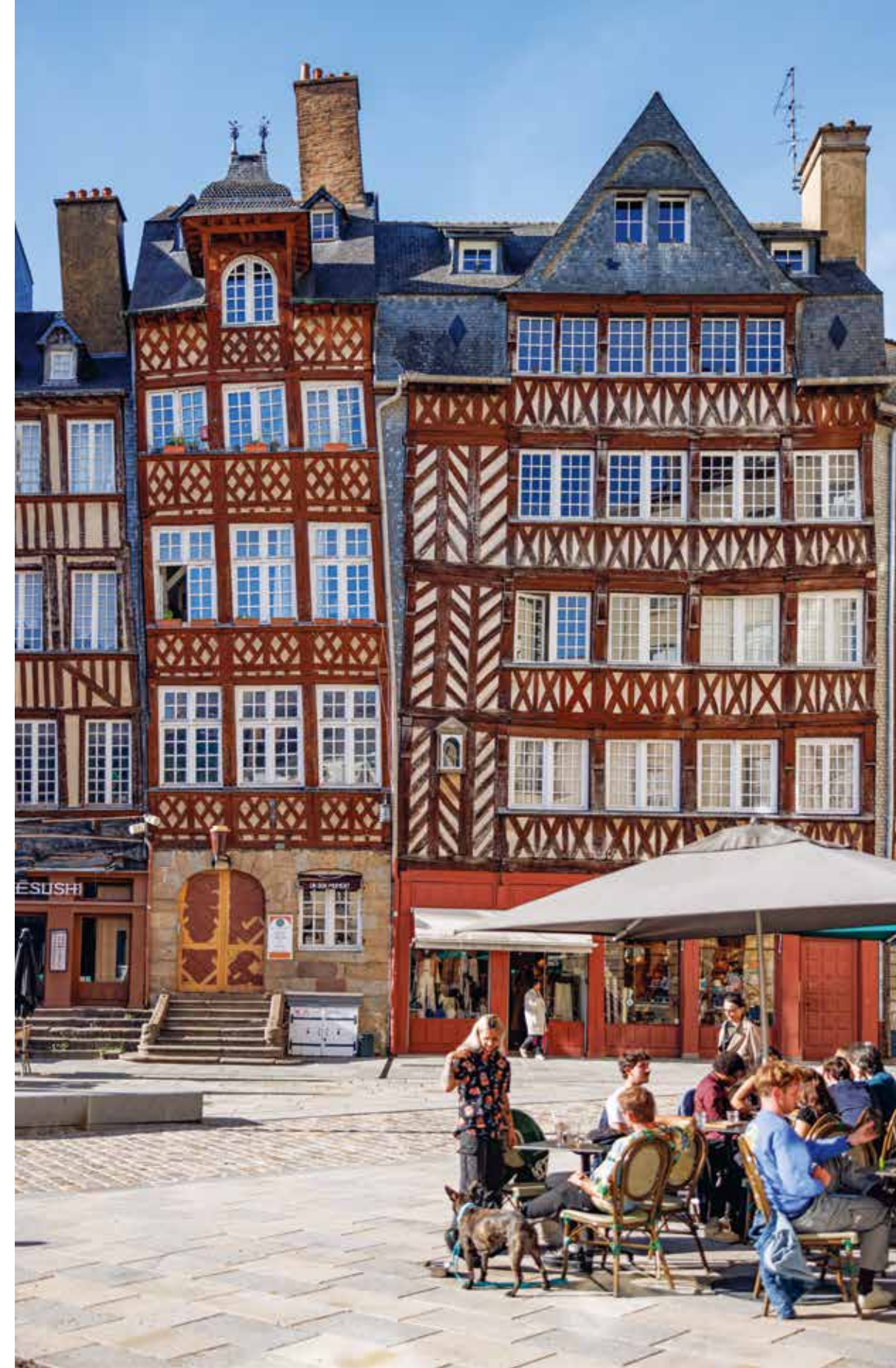
Standhaft auch nach über 500 Jahren – die maisons à colombages in Rennes

Im Sommer verwandeln sich viele Flussufer, Höfe oder Hausboote in lebhaft Freiluftlokale – Guinguettes genannt –, wo getanzt, gesungen und natürlich geschlemmt wird.