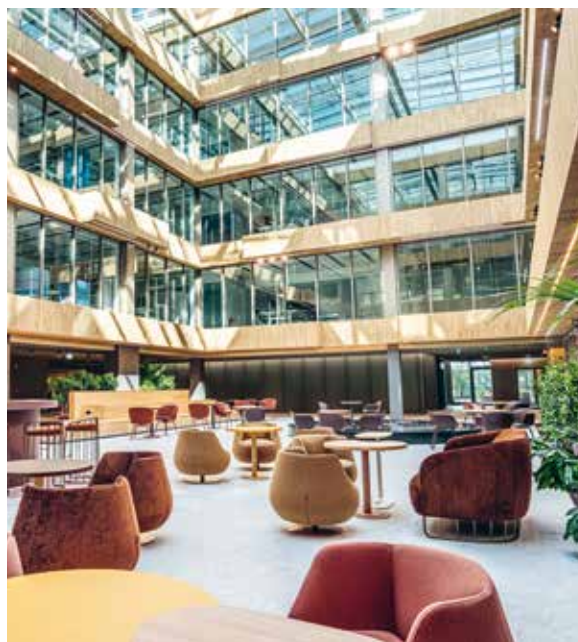
Eine unverzichtbare Inspirationsquelle für Architekten und Bauherren