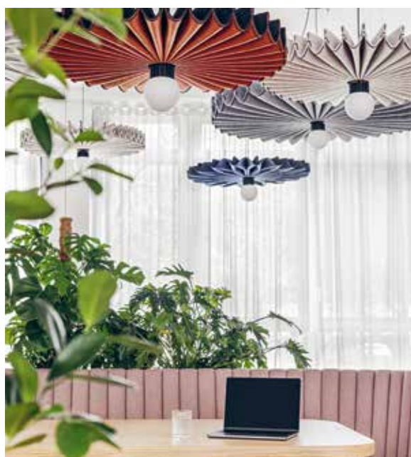
Ausführliche Gebäudeporträts mit Fotos, Planmaterial und Interviews

Die Arbeitswelt schafft die Grundlage für unseren Alltag. Gerade deshalb erscheint es uns so wesentlich, die Orte und Räume der Arbeit, die Workspaces, mit Kompetenz, Engagement und Zukunftssensibilität zu gestalten. Unternehmen und Gestaltungsbüros entwickeln dabei inzwischen kontinuierlich neue Ideen und erweitern das Portfolio der Arbeitslandschaft, wobei sich Ergonomie- mit Produktivitätsoptimierung und kreative Gestaltungsideen mit atmosphärischen Verbesserungen mischen. Um dies mit eindrücklichen und spezifisch ausgewählten Konzepten abzubilden und Anregungen für das Interieur, den Hochbau und clevere Produkte zu geben, legt der Callwey Verlag hier nun seine vierte Publikation zum Wettbewerb Best Workspaces vor. Zu sehen sind herausragende Beispiellösungen aus dem Bereich Interior Design und Bürobau, ausführlich illustriert und kommentiert. Lassen Sie sich anregen – zu einer engagierten Arbeitskultur.