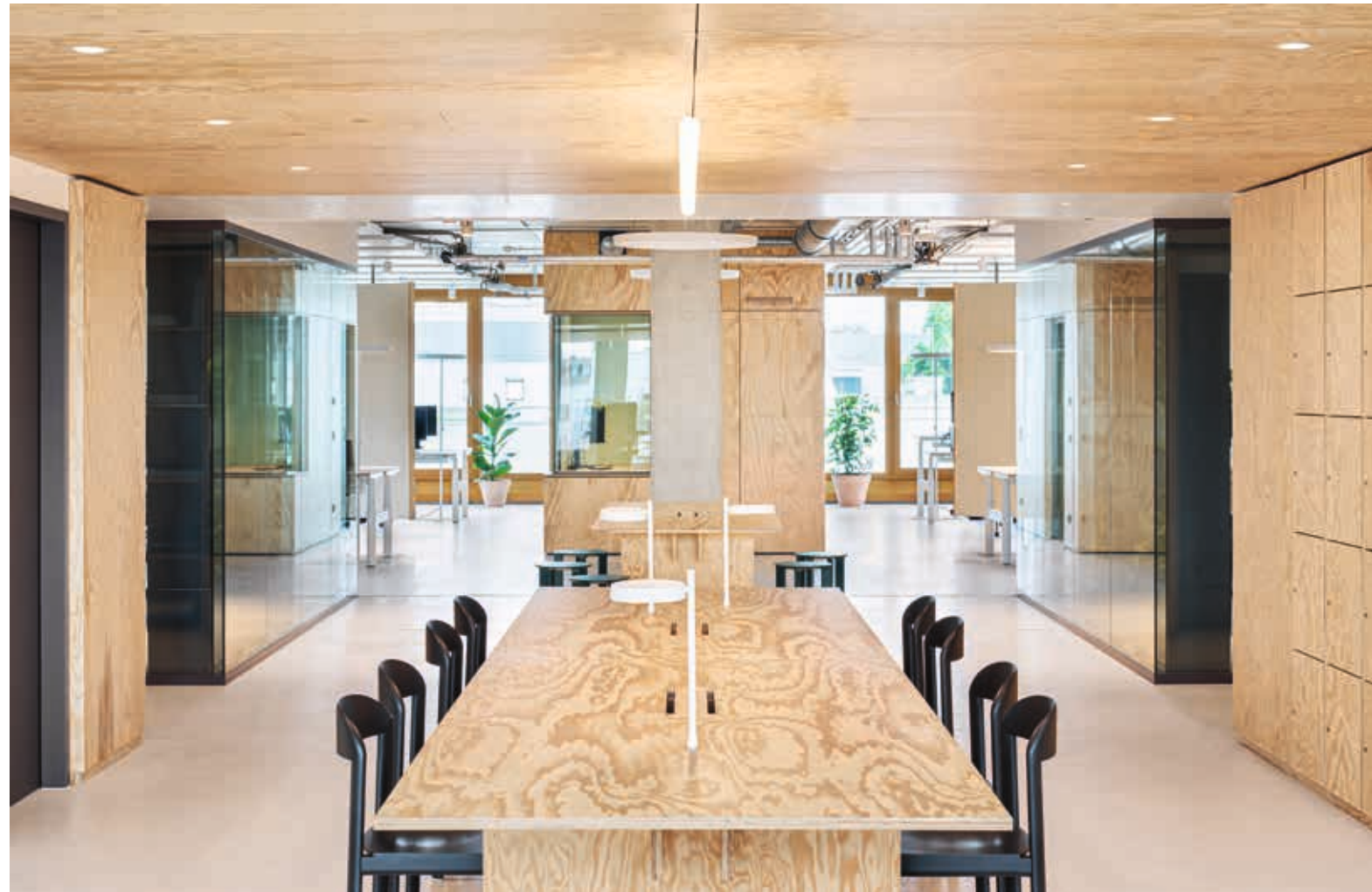
Vorige Seite: Ein angenehmer Empfang bei Ramboll: Die Theke offeriert kalte und heiße Getränke.