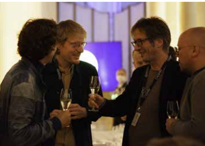
Spannende Gespräche beim Netzwerken.