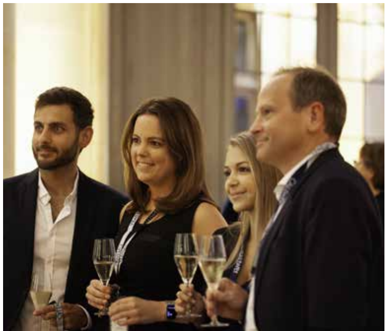
In freudiger Erwartung auf den Abend!