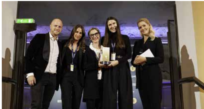
Glückliche Gesichter auf der Bühne.