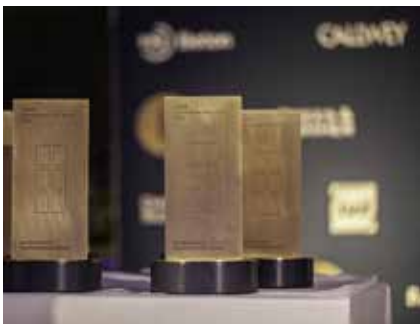
Handgefertigte Trophäen aus Deutschland.