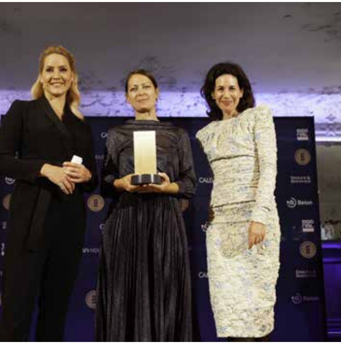
Judith Rakers begeisterte in diesem Jahr mit professioneller und humorvoller Moderation.