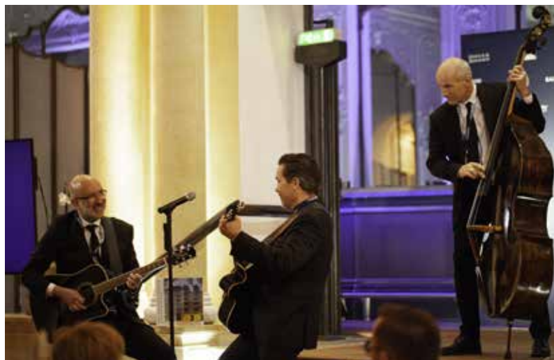
Für Unterhaltung ist gesorgt!