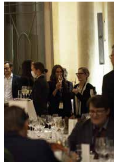
Prost! Das Begrüßungsgetränk läutet den Abend ein.