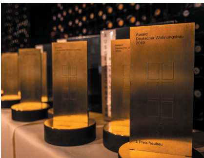
Die begehrte Trophäe des Awards.