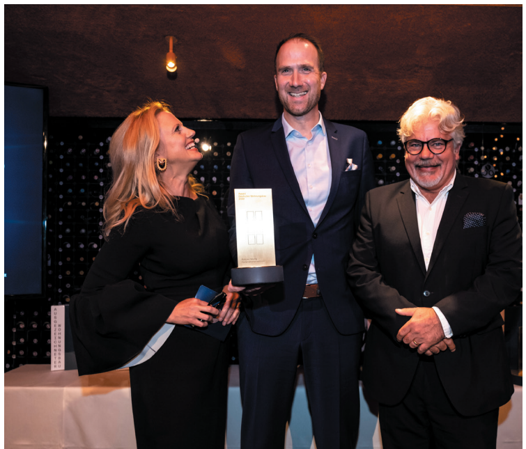
Stolze Gewinner mit Moderatorin Barbara Schöneberger.