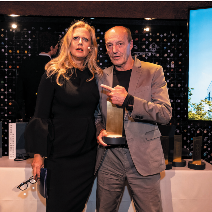
Die bekannte Moderatorin Barbara Schöneberger verlieh der Preisverleihung die extra Portion Glamour.