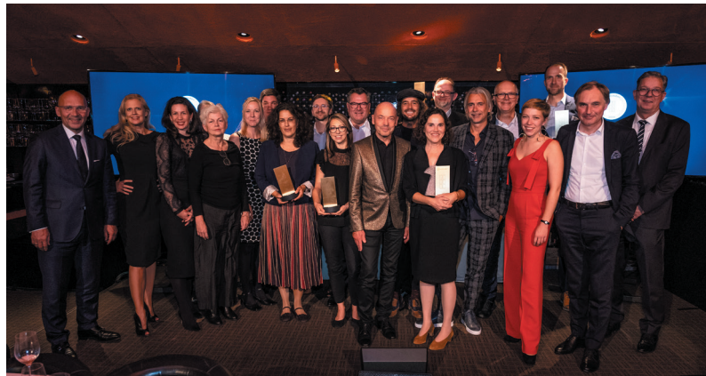
Die stolzen Gewinner mit der Jury und Moderatorin Barbara Schöneberger.