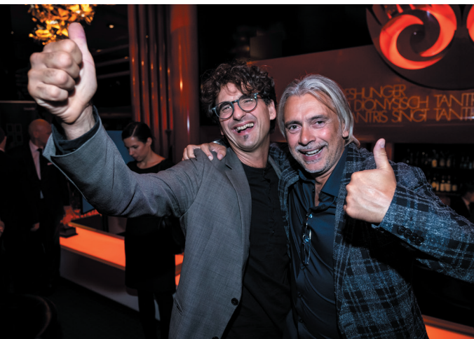
Die Preisverleihung „Ausgezeichneter Wohnungsbau 2019“: Ein voller Erfolg!