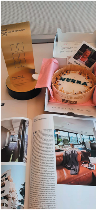
In diesem Jahr freuten sich die Gewinner über ein Paket mit Kuchen aus Omas Küche.

Leider konnten wir dieses Jahr aufgrund der aktuellen Situation die Preisverleihung nicht so feiern, wie wir uns das gewünscht hätte. Gerne geben wir Ihnen einen Einblick in das Event des Awards 2019.